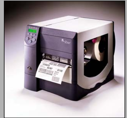
Abb.: Z 4M Art.-Nr.:250A21024360

Durch die verschiedenen Möglichkeiten der Optionen ist der Z 6M sehr flexibel, ohne Ihr Budget zu belasten. Durch den neuen ZPLII-Basic Interpreter können auch „fremde“ Druckerkommandos verarbeitet werden (geringer Aufwand bei der Umstellung vorhandener Label-Printer). Durch Standardfunktionen wie Auto-Kalibrierung, E3 Energiesteuerung, usw., bietet der Z 6M ein unübertroffenes Preis-Leistungs Verhältnis.