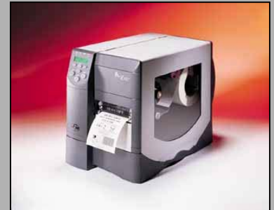
Abb.: Z 4M Art.-Nr.:250A21024360

Durch die verschiedenen Möglichkeiten der Optionen ist der Z 4M sehr flexibel, ohne Ihr Budget zu belasten. Durch den neuen ZPLII-Basic Interpreter können auch „fremde“ Druckerkommandos verarbeitet werden (geringer Aufwand bei der Umstellung vorhandener Label-Printer). Durch Standardfunktionen wie Auto-Kalibrierung, E3 Energiesteuerung, usw., bietet der Z 4M ein unübertroffenes Preis-Leistungs Verhältnis.