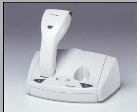
Abb.: ScanPlus 1802 + 2-fach Ladestation

Die Scanner der ScanPlus 1802-Serie sind für die „kleine Funklösung“ entwickelt worden. Wo ein Kabel den Ablauf einer Tätigkeit stört, können Sie mit der 1802-Serie in einem Bereich von 30 m „kabel-los“ scannen. Die Scanner der 1802-Serie zeichnen sich genau wie die kabelgebundenen durch eine Vielzahl innovativer Details aus. Ergonomisches Design, weicher Drei-Finger-Triggerschalter und großer Good-Read-LED (Triggerschalter standard bei ST, bei SR optional.)